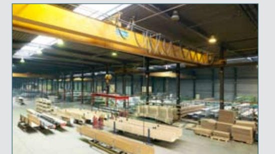
Verpakking & distributie